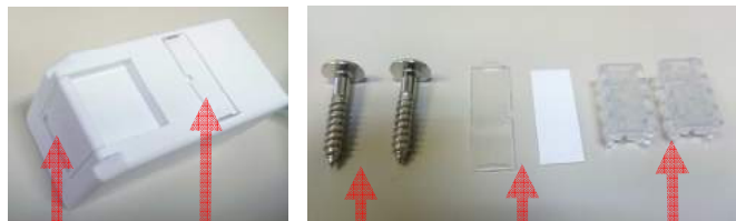
ダストカバー 取付用木ネジ ネームプレート キャップ ネームプレート取付位置