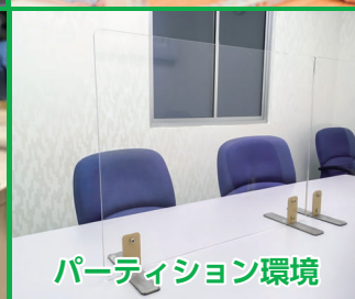
パーティション環境